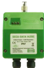
LRC 3 Control