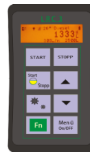
LRC 3 RC