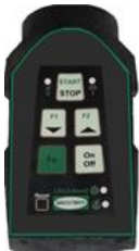
LRC 3 Small

Das LRC3 System besteht aus dem Handsender LRC3 Small , einem Schaltverstärker mit integrierter Empfängereinheit LRC3 Control und dem optionalen Zusatzhandsender LRC3 RC .